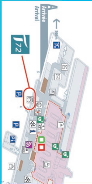
Aéroport de Genève

J'achète mon billet en ligne sur transalis.fr