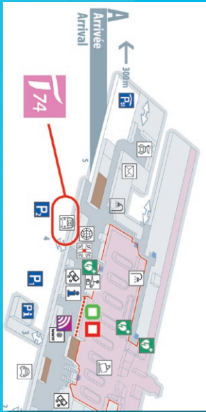
Aéroport de Genève

J'achète mon billet en ligne sur transalis.fr