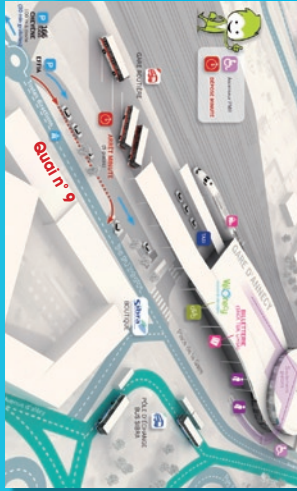
Gare routière d'Anney (quai n°9)