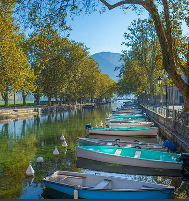
Les Cars de la Région Auvergne-Rhône-Alpes

Du 04 Septembre 2023 au 01 Septembre 2024