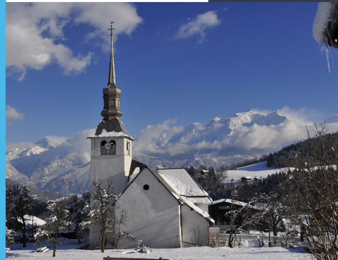
Les Cars de la Région Auvergne-Rhône-Alpes